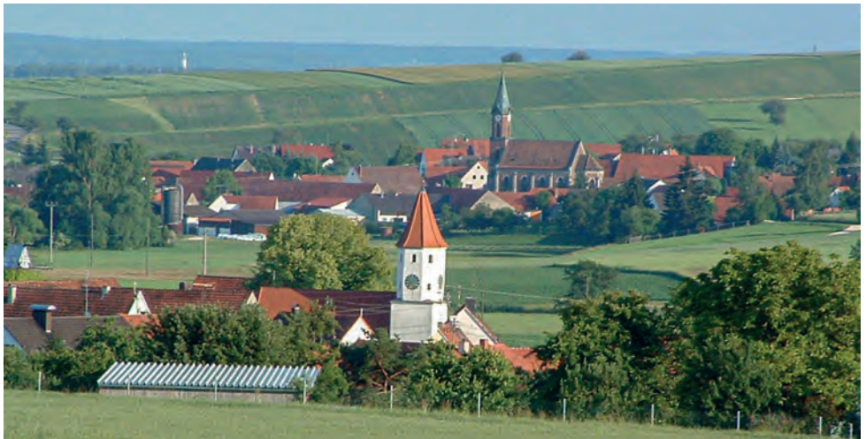
Im Vordergrund St. Blasius, Oppertshofen, dahinter die Maria-Magdalena-Kirche in Brachstadt

Die Maria-Magdalena-Kirche in Brachstadt wurde 1896 geweiht, sie ersetzte eine kleine Kapelle an selbiger Stelle aus dem Jahre 1518. Die Kirche ist in neugotischem Stil erbaut, der Innenraum ist seit