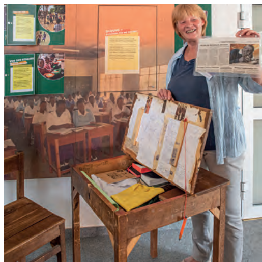
rechts: Ein altes Schulpult aus Tansania