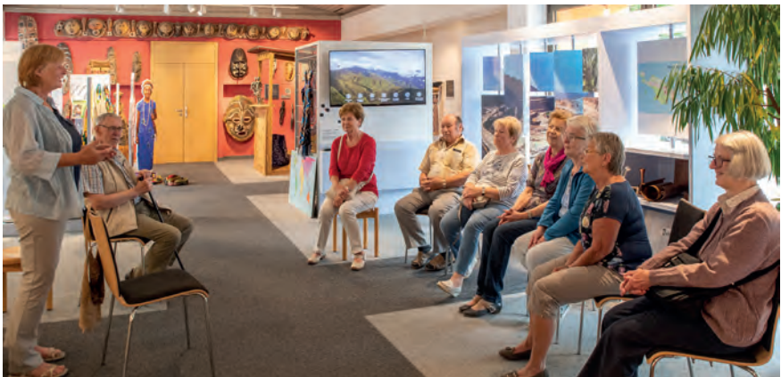
oben links: Hier werden die Teige für die Hostien gebacken, die dann in einem weiteren Arbeitsgang ausgestanzt werden