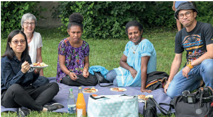
... beim Picknick mit ihrer Freundin und einigen ihrer Wegbegleiter*innen