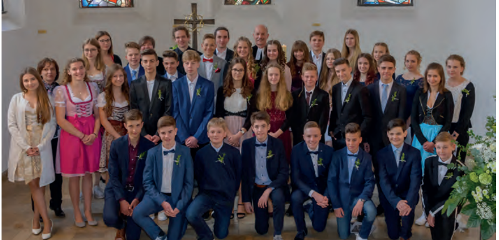
Konfirmation am Sonntag, Misericordias Domini, 5. Mai 2019

Zum Zeitpunkt der Konfirmationen im Mai 2019 befand sich der vorige Gemeindebrief bereits im Druck, sodass die Bilder von den Konfirmationen nicht mehr berücksichtigt werden konnten. Wir holen dies hiermit nach.