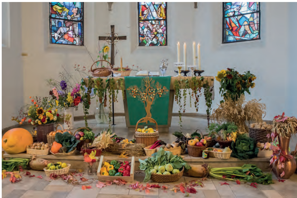
Der Erntedank-Altar am Sonntag, den 1. Oktober 2017