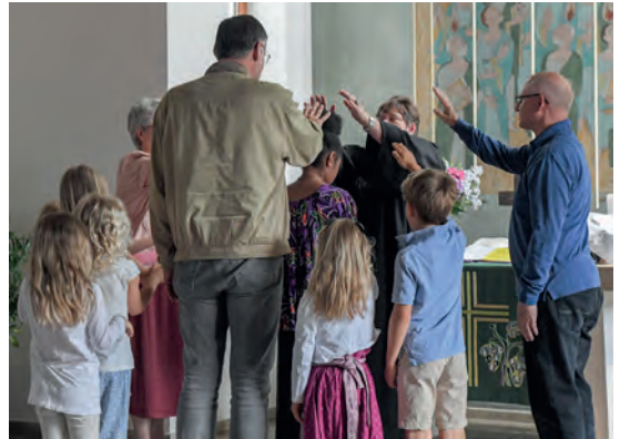
... bei ihrer Segnung