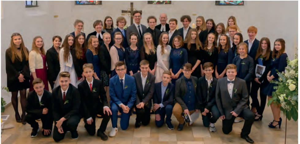
Konfirmation am Sonntag, Jubilate, 12. Mai 2019