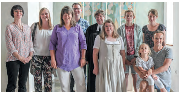
Auf dem Bild fehlen: Iris Ommer und Annika Stüwe